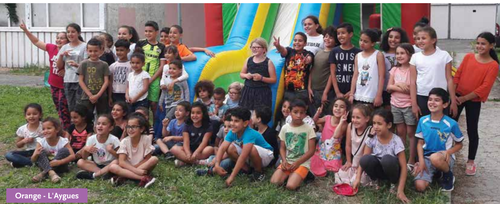
Orange - L'Aygues

Le soleil était de la partie ! C'est donc dans une joyeuse atmosphère que de nombreuses résidences ont participé au traditionnel rendez-vous de la fête des voisins qui s'est déroulé le 25 mai. Et comme chaque année, les équipes de MISTRAL habitat se sont mobilisées pour l'organisation et les animations aux côtés des locataires. L'occasion de se rencontrer et d'échanger autour de gourmandises dans une ambiance des plus conviviales. Félicitations à tous pour cette réussite !