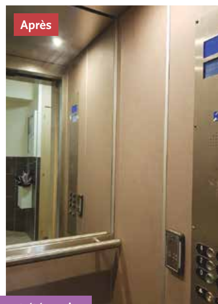
Les ascenseurs de la résidence les Lavandes ont entièrement été repris.