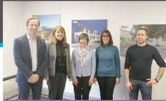
Les représentants du bailleur Côte d'Azur Habitat ont visité le SRC le 8 février.

Le SRC (Service relations clients) de MISTRAL habitat continue de susciter l'intérêt. Depuis la mise en place de cette plate-forme centralisée de réception des appels afin de mieux gérer les demandes administratives et techniques des locataires, plusieurs bailleurs ont rendu visite aux agents installés au Pontet. Dernière visite en date, celle de Côte d'Azur Habitat le 8 février. L'occasion de détailler le fonctionnement du service et de faire le point sur les dernières nouveautés. Parmi elles, la mise en place d'une astreinte.