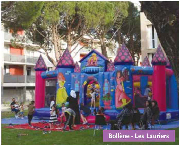
Bollène - Les Lauriers