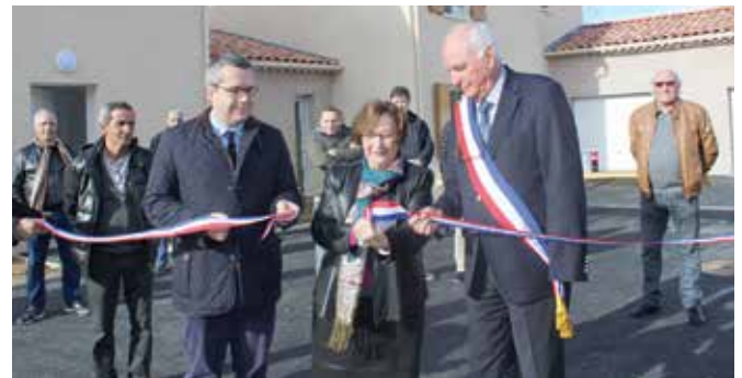
Les 5 pavillons ont été inaugurés le 22 janvier.

En collaboration avec la mairie de Pertuis et les services de l'Etat, MISTRAL habitat s'est alors employé à trouver un terrain qui permette la reconstruction des pavillons sur un site à proximité du Clos des Jardins, conformément aux vœux des familles concernées. C'est ainsi qu'est sorti de terre le nouveau lotissement baptisé "le Clos Jasmin". Composé de 5 pavillons (T4 et T5), il a été inauguré le 22 janvier dernier par le Président de l'office Jean-Baptiste Blanc, le maire de Pertuis, Roger Pellenc et la sous-préfète d'Apt, Dominique